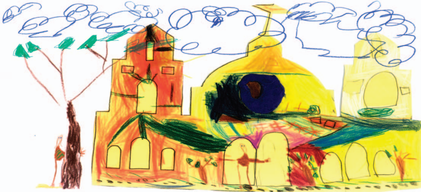
DIBUJO DE MARTÍN GONZÁLEZ

Columna publicada en el diario El Tiempo , cedida gentilmente por su autora.