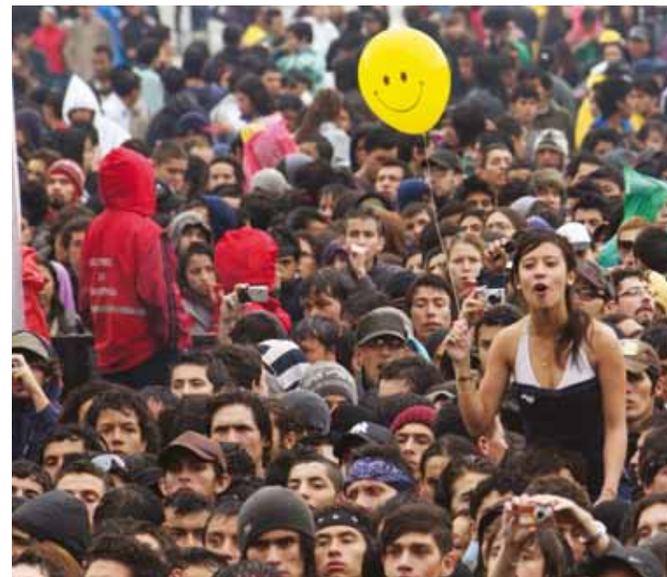
EL PÚBLICO CONVIVIÓ EN UNIDAD, ARMONÍA Y FELICIDAD.

“Rock al Parque 2010 fue un ejemplo de respeto en medio de la diferencia, un culto a la diversidad.”