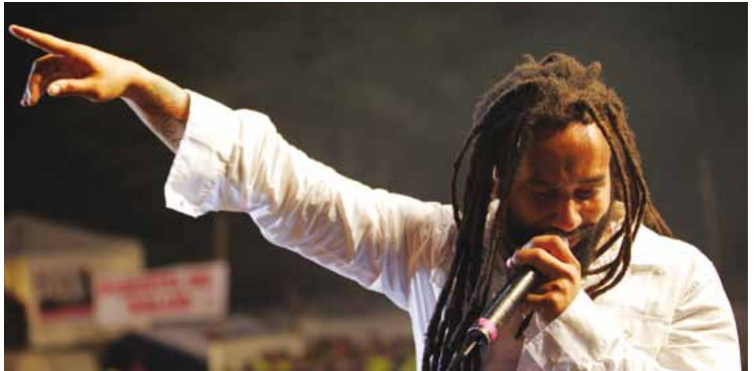
KY-MANI, EL HIJO DE BOB MARLEY, DEJÓ EN ALTO LA BANDERA DE JAMAICA.

Quienes no pudieron asistir también pudieron vivir Rock al Parque a través de Canal Capital, que en los tres días de fiesta transmitió el festival durante 13 horas en vivo y en directo.