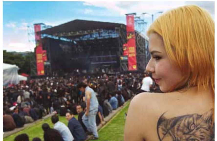
NADIE LE DIO LA ESPALDA AL ROCK AND ROLL.