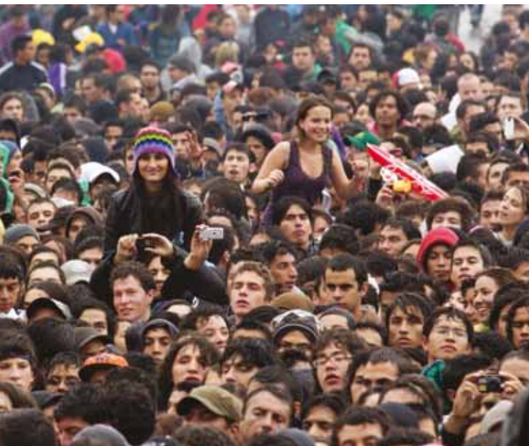
MÁS DE 260.000 PERSONAS ACUDIERON A LA CITA ROCKERA.