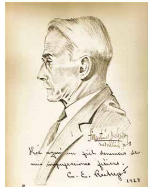
CARLOS E. RESTREPO