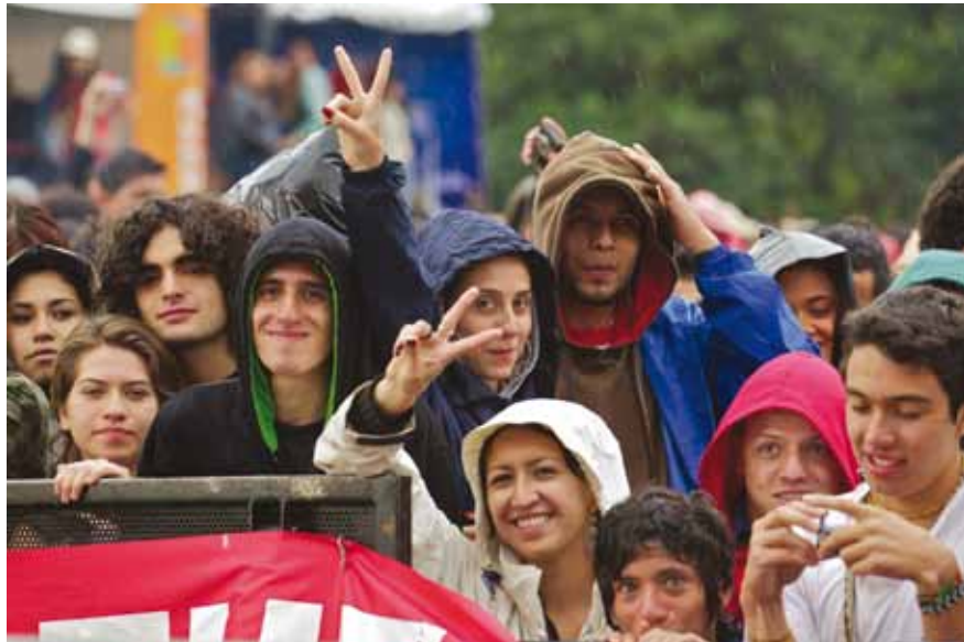
ROCK AL PARQUE, TRES DÍAS DE EXTREMA CONVIVENCIA.