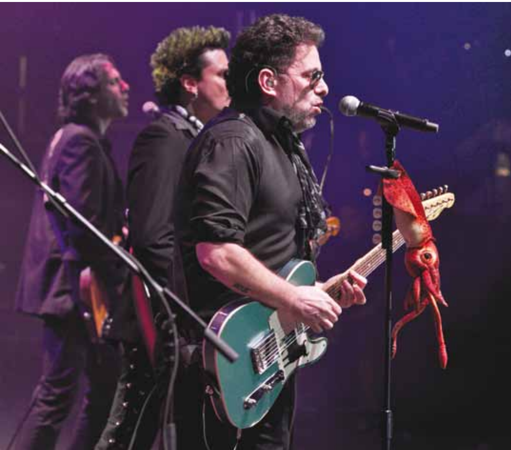
EL ARGENTINO ANDRÉS CALAMARO CERRÓ EL FESTIVAL CON BROCHE DE ORO.

D urante tres días, el parque Simón Bolívar le rindió culto a la música, al respeto por la diversidad y a la extrema convivencia. Entre el sábado 3 de julio y el lunes 5 de julio, 266 mil personas llenaron ese escenario.