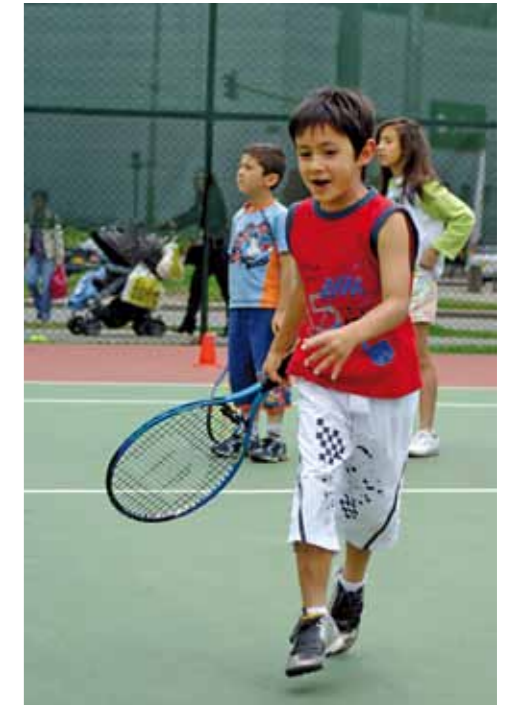
TENIS EN EL PARQUE EL SALITRE.

«Esos espacios verdes, con canchas, árboles, juegos infantiles, senderos y bancas, también evocan nuestro pasado, nuestro presente y nuestro futuro»