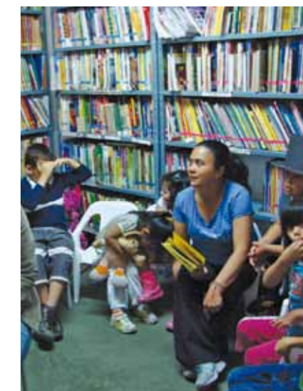
BIBLIOTECA COMUNITARIA EN ENGATIVÁ.