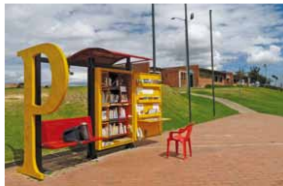
PARADERO PARA LIBROS PARA PARQUES (P.P.P.) EN KENNEDY