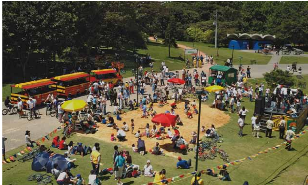
FESTIPARQUE EN EL PARQUE SIMÓN BOLÍVAR.

Por eso, uno de los factores más vitales de un vecindario, como también de una gran ciudad, es el grado de apropiación y de significación de sus parques. Es inimaginable como sería la vida de Nueva York sin su tradicional Central Park, o de