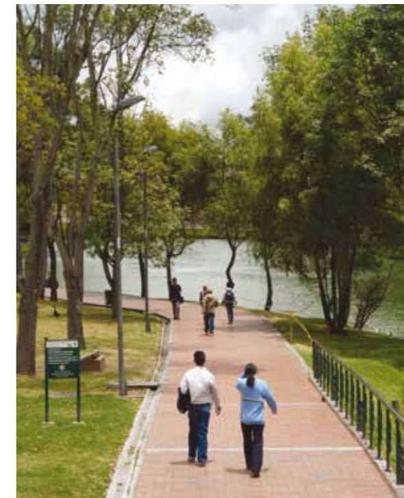
UNA DE LAS RUTAS DEL PARQUE SAN CRISTÓBAL.