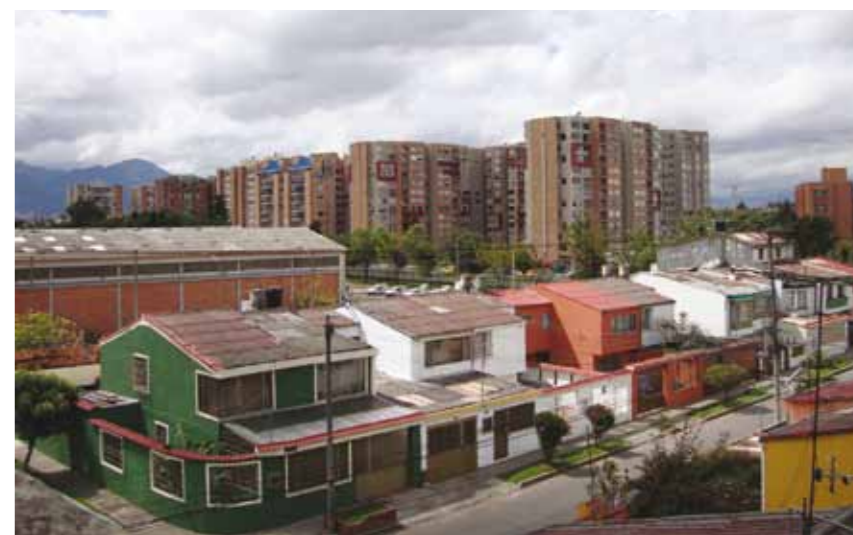
PANORÁMICA DE ENGATIVÁ DESDE LA TERRAZA DE LA CASA DE LA CULTURA.