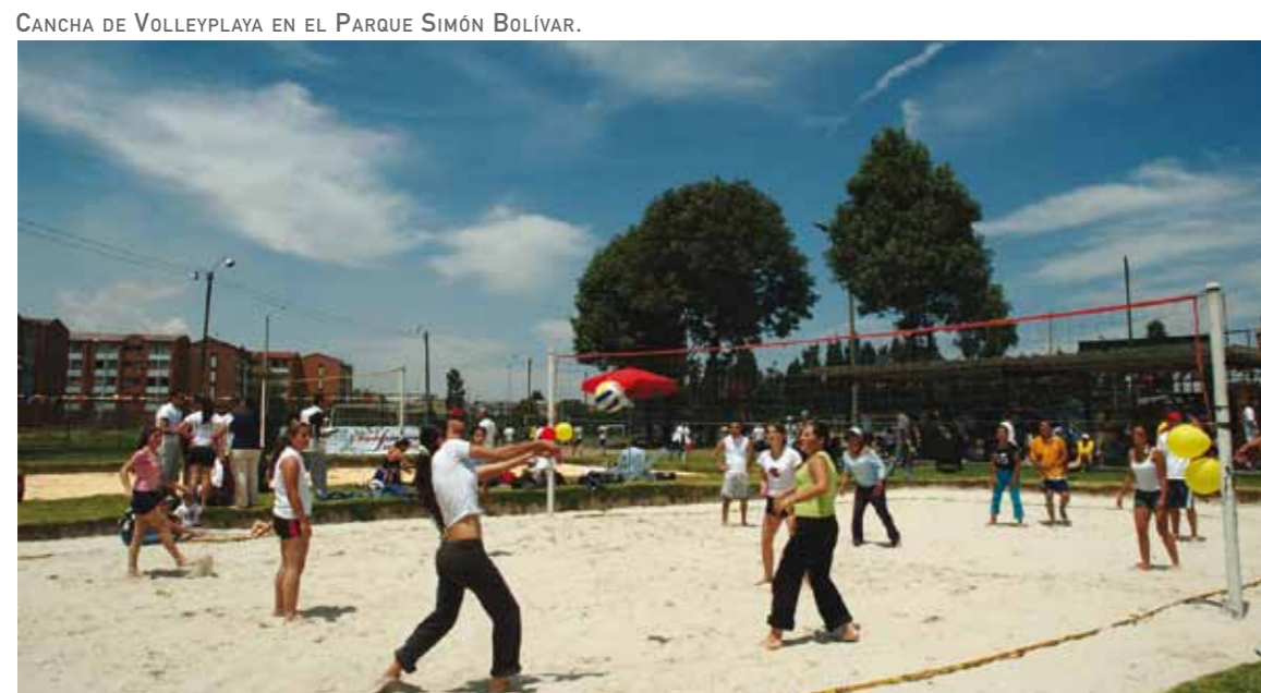
CANCHA DE VOLLEYPLAYA EN EL PARQUE SIMÓN BOLÍVAR.

Medellín sin su Parque de Berrío, o de Cali sin el Parque de la Salud o de Barranquilla sin el Parque Paseo Bolívar. O de Bucaramanga, que ha hecho de todos sus parques la esencia misma de su orgullo para ostentar el nombre de la Ciudad de los Parques, todos ellos emblemas para sus ciudades y elementos fundamentales en la vida de sus ciudadanos. Como también lo es en Santiago de Chile el parque Metropolitano, en Londres el Hyde Park, en Amsterdam el Voldempark, en Vancouver el Stanley Park, en Tokyo el Ueno Park, en Munich el Englischer Garten, en México el Parque de Chapultepec, y en Buenos Aires el Parque Lezama, ese sitio donde comienza la gran novela de Ernesto Sábato, Sobre Héroes y Tumbas , y en donde Martín, un muchacho solitario, conoce a Alejandra, el tormentoso amor de su vida.