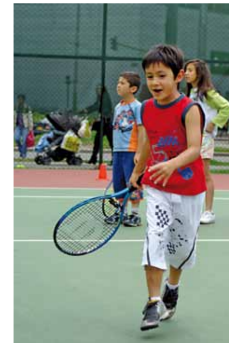
TENIS EN EL PARQUE EL SALITRE.

«Esos espacios verdes, con canchas, árboles, juegos infantiles, senderos y bancas, también evocan nuestro pasado, nuestro presente y nuestro futuro»