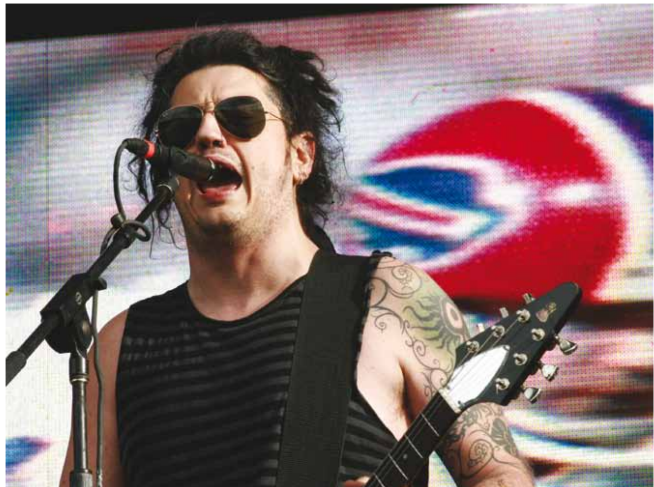
CON ROCK AL PARQUE ARRANCA LA TEMPORADA DE FESTIVALES AL PARQUE

BOGOTÁ BICENTENARIO de la Independencia de Colombia