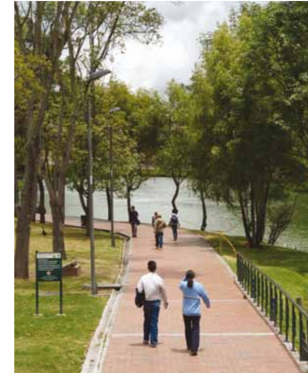
UNA DE LAS RUTAS DEL PARQUE SAN CRISTÓBAL.