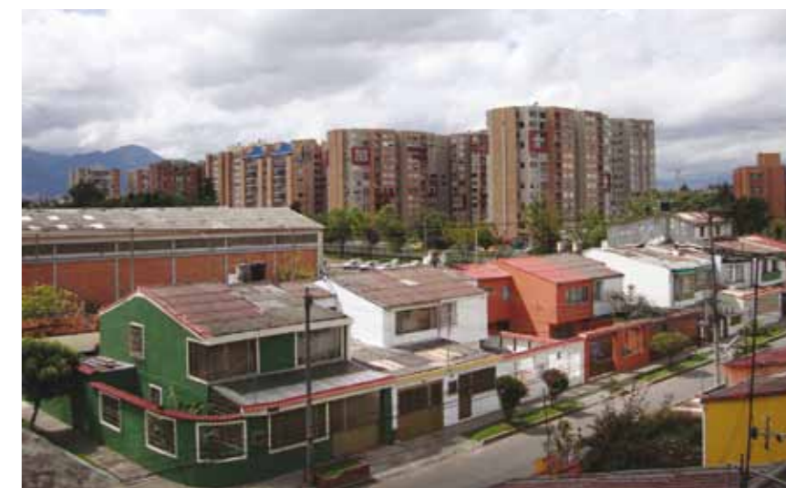
PANORÁMICA DE ENGATIVÁ DESDE LA TERRAZA DE LA CASA DE LA CULTURA.