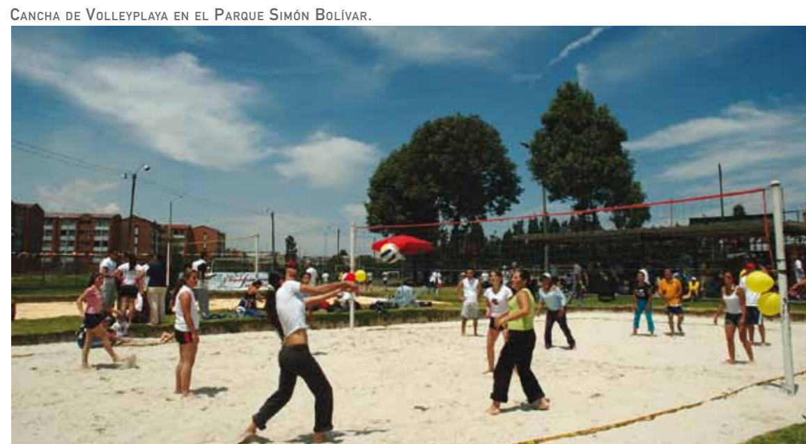
CANCHA DE VOLLEYPLAYA EN EL PARQUE SIMÓN BOLÍVAR.

Medellín sin su Parque de Berrío, o de Cali sin el Parque de la Salud o de Barranquilla sin el Parque Paseo Bolívar. O de Bucaramanga, que ha hecho de todos sus parques la esencia misma de su orgullo para ostentar el nombre de la Ciudad de los Parques, todos ellos emblemas para sus ciudades y elementos fundamentales en la vida de sus ciudadanos. Como también lo es en Santiago de Chile el parque Metropolitano, en Londres el Hyde Park, en Amsterdam el Voldempark, en Vancouver el Stanley Park, en Tokyo el Ueno Park, en Munich el Englischer Garten, en México el Parque de Chapultepec, y en Buenos Aires el Parque Lezama, ese sitio donde comienza la gran novela de Ernesto Sábato, Sobre Héroes y Tumbas , y en donde Martín, un muchacho solitario, conoce a Alejandra, el tormentoso amor de su vida.