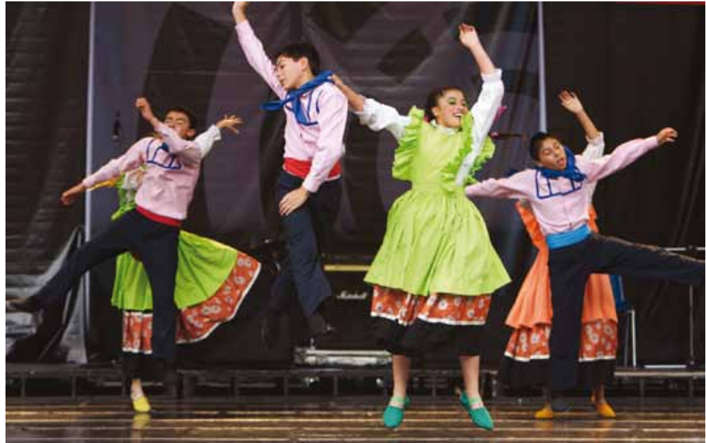
DANZA KAPITAL / BOGOTÁ