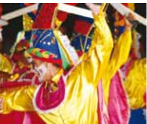
CORPORACIÓN CULTURAL BARRANQUILLA

opolitano que reúne todos los 14 compañías internacionales, es, 3 artistas colombianos 9 propuestas alternativas. questa Filarmónica de Bogotá)