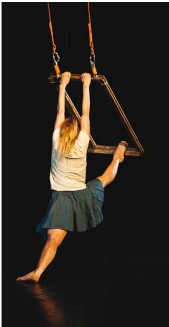
TRIKNIA DANCE COMPANY / ALEMANIA