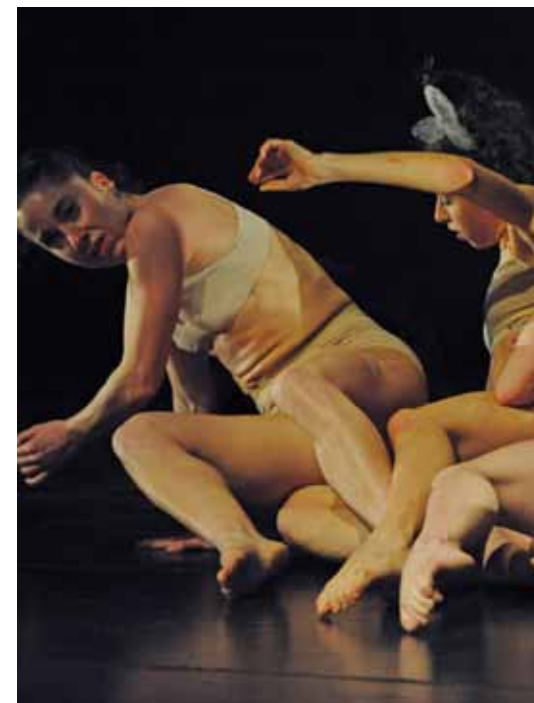
DANCE DRAMA COMPANY / ISRAEL

Estos artistas se presentarán en escenarios de la ciudad como los teatros Jorge Eliécer Gaitán, Libre y Varasanta, en algunas bibliotecas de Biblorred, en la Fundación Gilberto Alzate Avendaño y en el Centro Cultural Media Torta. Adicionalmente habrá espacios alternativos como los centros comerciales Avenida Chile y El Tunal, con propuestas de fundaciones a quienes la OFB y el Ministerio de Cultura otorgaron becas de creación y se sumarán a la promoción de una campaña de tolerancia frente a portadores del síndrome VIH.